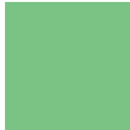
Bánghlas C53 M2 Y63 K0 R126 G193 B133 HEX: 7dc185