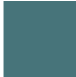
Téal C75 M42 Y45 K12 R72 G116 B123 HEX: 47747a