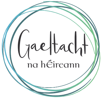
Lógó Iomlán – rogha 2, dubh - Ar Chúlra Geal