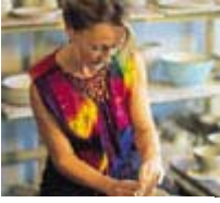
Pobal & Cultúr

Is é caomhnú agus láidriú na Gaeilge mar theanga bheo sna pobail Ghaeltachta agus a tabhairt ar aghaidh chuig an gcéad ghlúin eile bunús pholasaí Údarás na Gaeltachta. I gcoilár gach gníomhaíochta de chuid na heagraíochta tá cuspóir cothaithe agus forbartha teanga. Ag aithint an róil bhunúsaigh a ghlacann an pobal chun an cuspóir sin a chur chun cinn, tá cuid mhaith de na sainghníomhaíochtaí fréamhaithe i ngníomhaíochtaí forbartha pobail agus pobalbhunaithe.