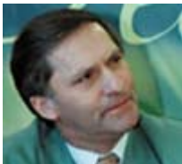
Ráiteas an Chathaoirligh